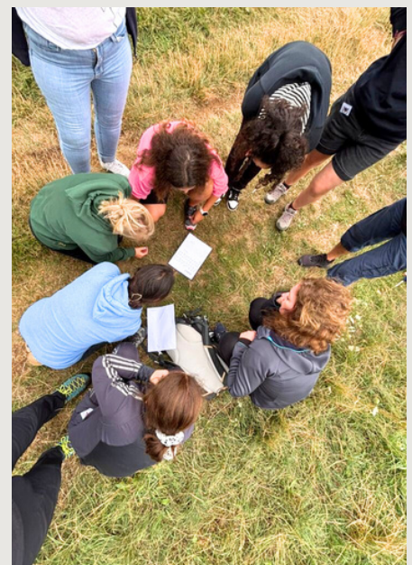
Défi résolution d'énigmes.