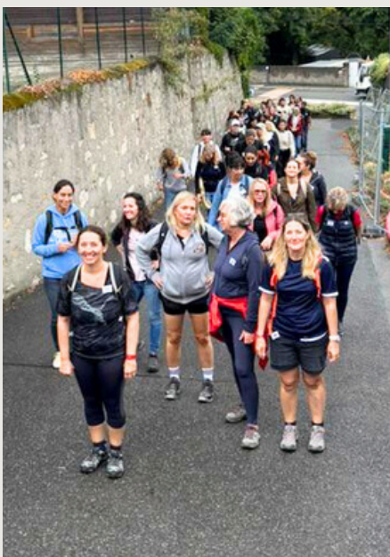
Montée au Salève.