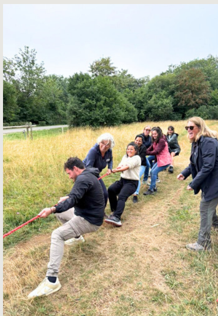
Défi tir à la corde.