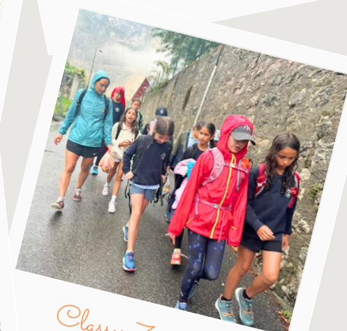
Classes 7 et 8P