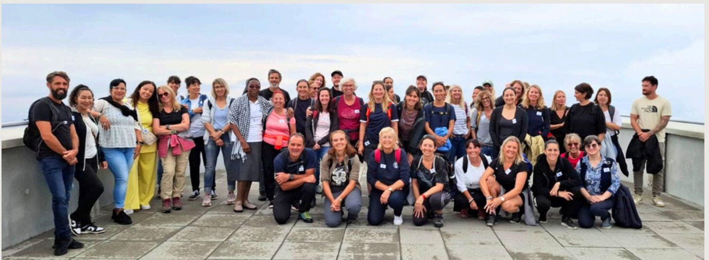
Journée de cohésion du personnel, terrasse panoramique du téléphérique du Salève.