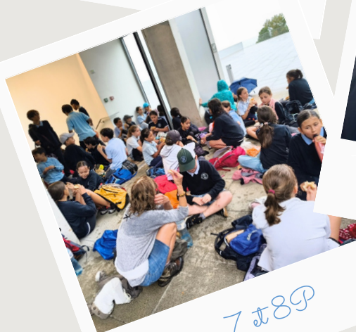
Classes 7 et 8P